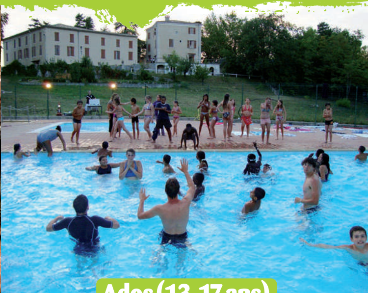
Ados (13-17 ans)